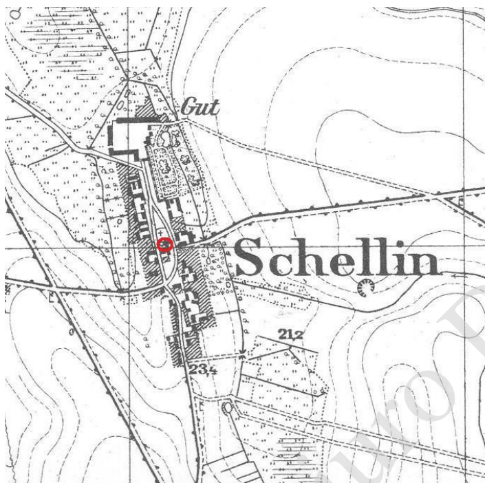
Messtischblatt 1929, karta 2655