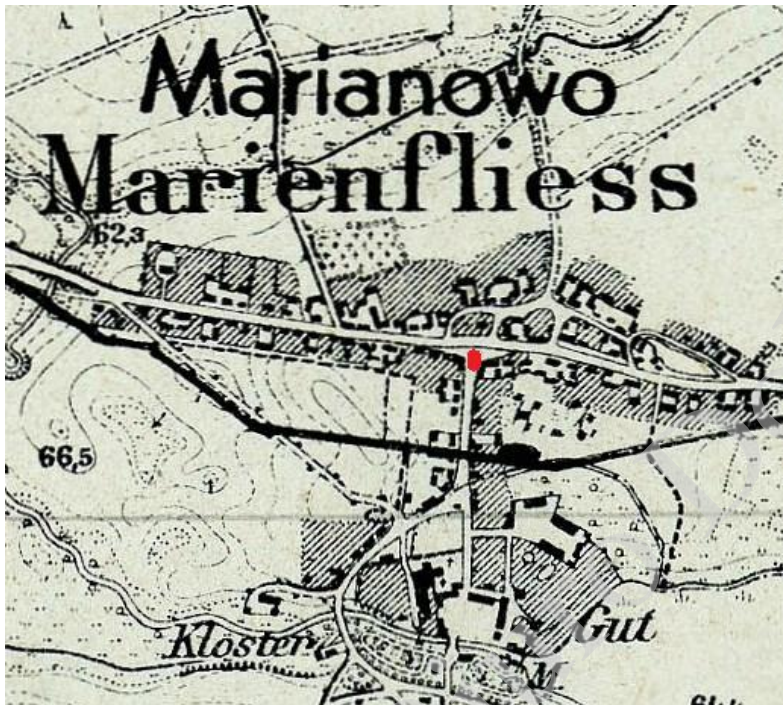
Messtischblatt 1948, nr 2657