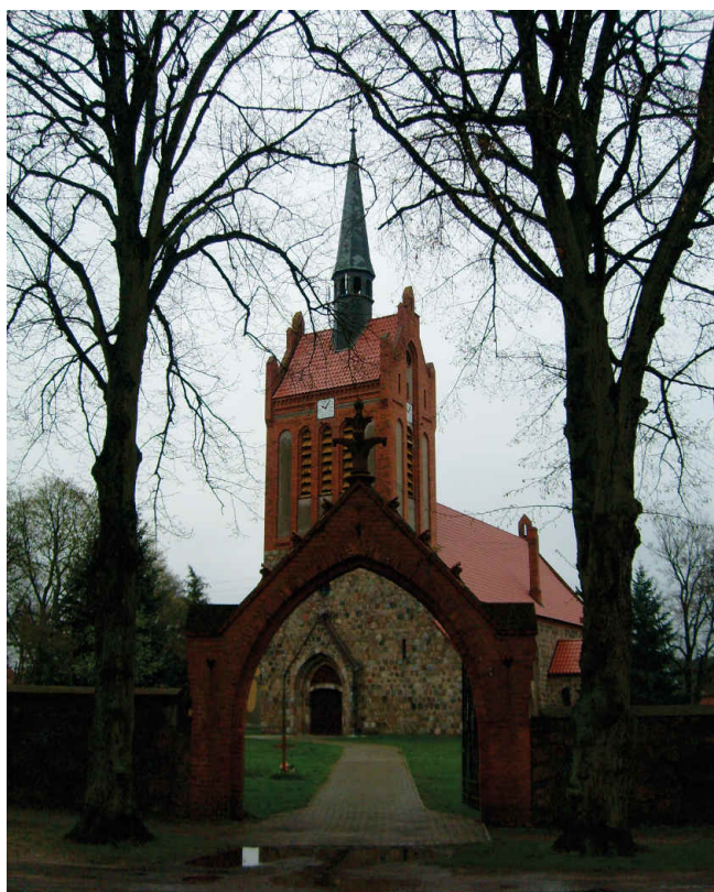
6. Bramka cmentarna i widok zachodniej fasady kościoła p.w. Matki Bożej Wspomożenia Wiernych w Dargomyślu.

Kościół filialny p.w. Matki Bożej Wspomożenia Wiernych zlokalizowany w oddalonym o 3 kilometry od Chwarszczan Dargomyślu także należy do najstarszych w okolicy. Wygląd świątyni jest wynikiem kilku etapów prac budowlanych – pierwotnego gotyckiego z okresu XIII wieku i dalszych przebudów i rozbudów dokonywanych w kolejnych stuleciach, aż po koniec wieku XIX.