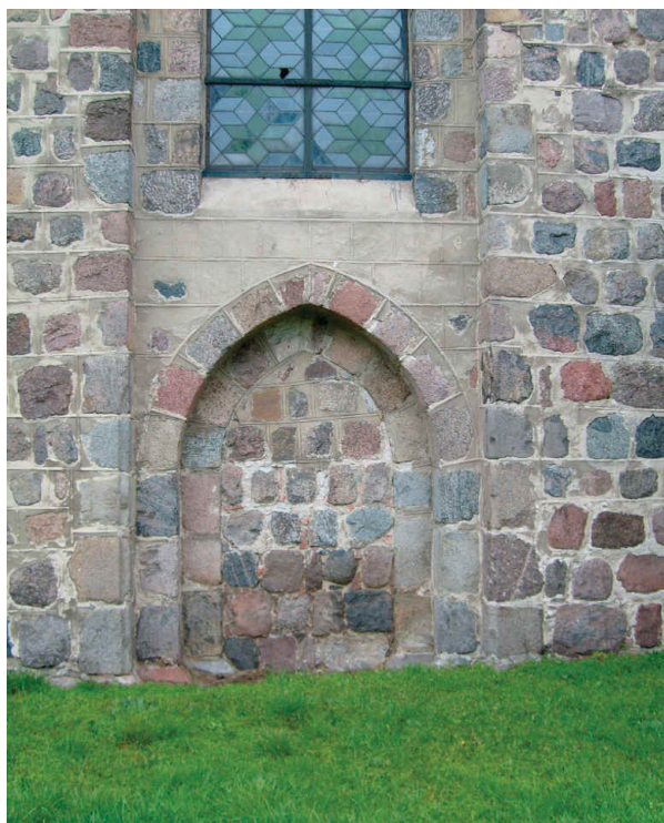
7. Ściana południowa kościoła p.w. Matki Bożej Wspomożenia Wiernych w Dargomyślu. Zamurowane XIII-wieczne wejście z portalem.

okna. W elewacji południowej zachował się kamienny ostrołukowy portal, stanowiący pozostałość pierwotnego wejścia, w późniejszym okresie zamurowanego. W następnych stuleciach rozbudowano nawę w kierunku zachodnim, usuwając ścianę z głównym portalem wejściowym i dobudowując masywną kamienną wieżę.