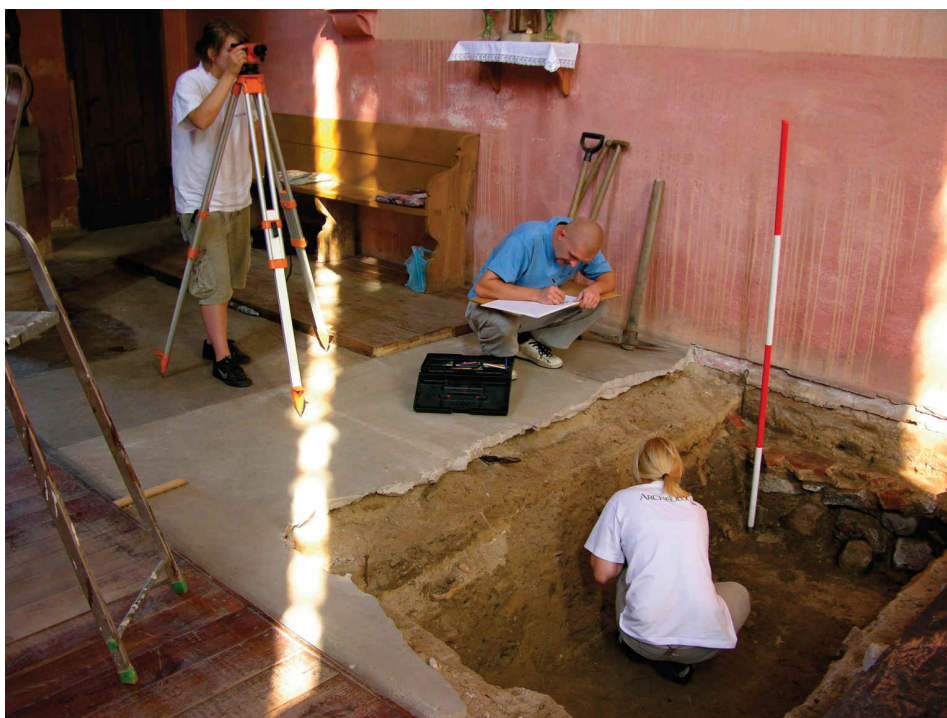
2. Badania archeologiczne wewnątrz kaplicy zakonnej (odkrywanie fundamentu pierwszej świątyni).

Współcześnie prowadzone wewnątrz badania archeologiczno-architektoniczne pozwoliły na odkrycie pozostałości ław fundamentowych wcześniejszej, mniejszej świątyni. Prawdopodobnie wzniesiono ją w pierwszej fazie istnienia komandorii z granitowych kwadr, których następnie użyto przy budowie cokołu świątyni gotyckiej. Pierwotna świątynia była zapewne jednonawową, prostą budowlą z wydzielonym prezbiterium, przypominając zachowaną bryłę kaplicy w Rurce koło Chojny. Rozebrano ją w okresie rozbudowy dworu zakonnego w 2. połowie XIII wieku.