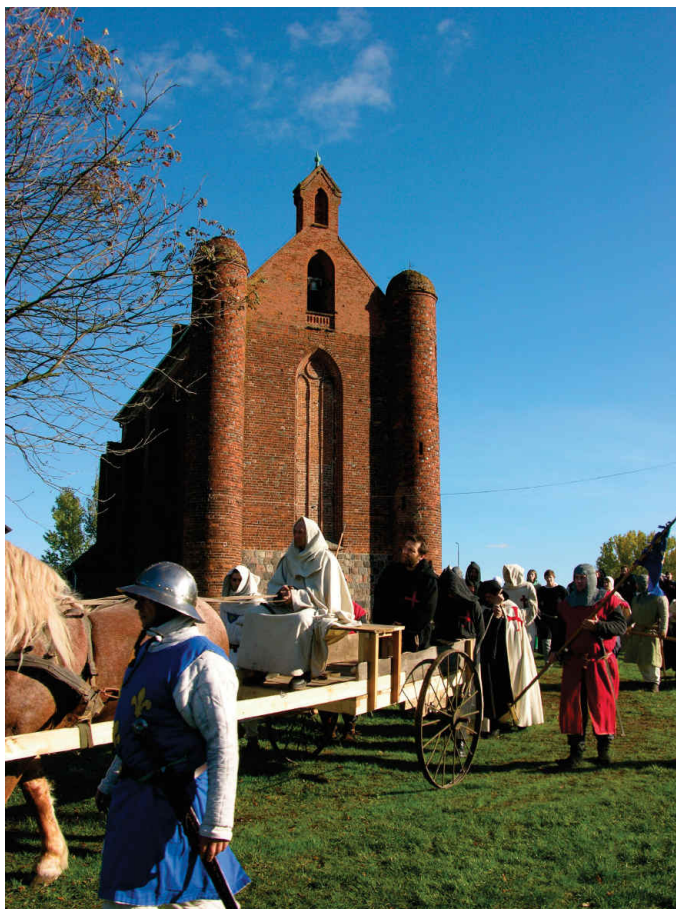
1. Kościół p.w. Św. Stanisława Kostki w Chwarszczanach (kaplica zakonna). Widok od zachodu w trakcie inscenizacji odtwarzającej upadek zakonu templariuszy (13.10.2007).

Według zachowanych informacji przybyli do Chwarszczan ( Chwarsane ) w 1232 roku rycerze zakonni otrzymali w nadaniu wieś wraz z tysiącem łanów do zagospodarowania. Od lat w literaturze przedmiotu poruszana jest kwestia zaangażowania zakonników w rozwój osadnictwa na przekazanych im terenach. Część badaczy twierdzi, że po prostu zajmowali oni istniejące wsie, inni zaś, że znacząco wpłynęli na rozwój przejętych terenów poprzez rozbudowę starych niewielkich osad i zakładanie nowych.