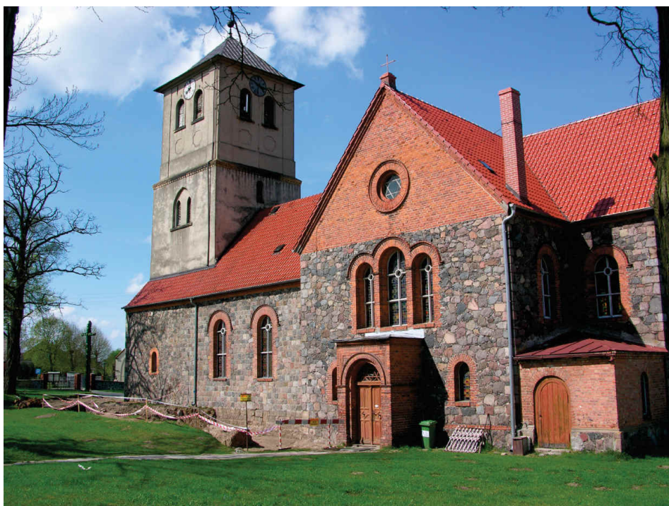
3. Istniejąca bryła kościoła p.w. Św. Stanisława Biskupa i Męczennika w Cychrach od strony południowej.

Czynności liturgiczne w nowych świątyniach parafialnych na terenach zarządzanych przez templariuszy sprawował, przynajmniej początkowo, kapelan zakonu. Relikty architektoniczne dwóch kościołów przetrwały jako części konstrukcji przebudowanych świątyń w Cychrach i Dargomyślu. Obie miejscowości wymieniono w XIII-wiecznych dokumentach dotyczących komandorii templariuszy z Chwarszczan (Dargomyśl jako Dargumiz w 1234 roku, Cychry jako Tyscher w 1262 roku).