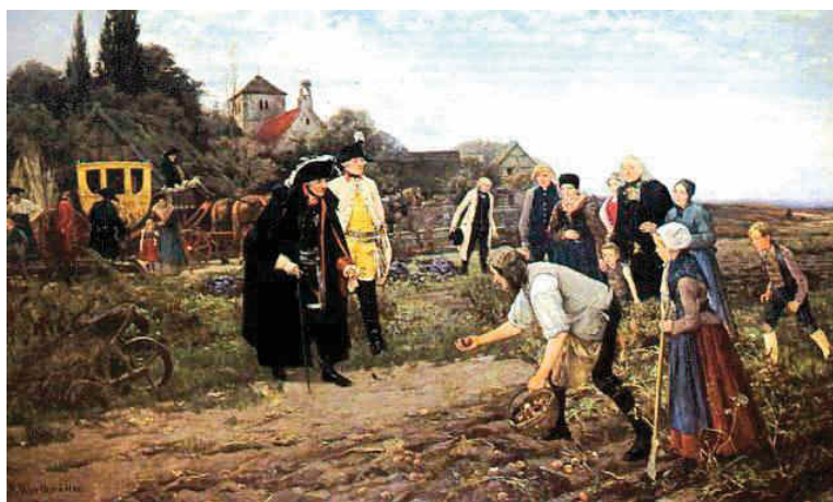
8. Reprodukacja obrazu Der König überall (Wszechobecny król - podczas inspekcyjnej podróży przy zbiorze ziemniaków w Dargomyślu) autorstwa R. Warthmüllera z kościołem w tle. Repr. za: www.wimbp.gorzow.pl

Obecna budowla posiada plan prostokąta o przybliżonych wymiarach 25×12 m i szerokości nawy głównej około 10 m. Do północnej elewacji przylega kwadratowa w planie zakrystia, do południowej kruchta, podobna znajduje się przy południowej ścianie masywu wieżowego. Korpus budowli nakrywa dwuspadowy dach. Nad całością góruje trójkondygnacyjna wieża przykryta także dwuspadowym dachem i zwieńczona ażurową latarnią z wysokim hełmem. Forma dominującej nad zabudową, jeszcze kamiennej, wieży kościoła znana jest z płótna gorzowskiego malarza Roberta Warthmüllera (1886), który uwiecznił Dargomyśl w dziele przedstawiającym wizytę króla Fryderyka II Wielkiego.