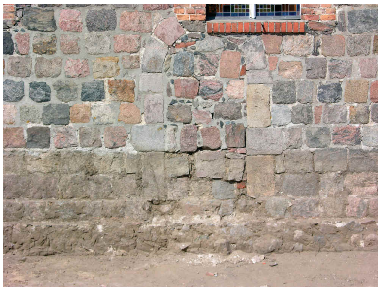
4. Ściana południowa kościoła p.w. Św. Stanisława Biskupa i Męczennika w Cychrach. Zamurowane pierwotne wejście z romańskim portalem

bocznego wejścia. W późnym średniowieczu do części zachodniej dobudowano masyw wieżowy – w dolnej partii wykonany z głazów narzutowych, w górnych z cegieł. W ścianie zachodniej oddzielającej kruchtę wieży od nawy umieszczono schodkowy portal zakończony łagodnym ostrym łukiem. Po upadku zakonu templariuszy w XIV wieku kościół w Cychrach przejęli joannici, kolejni rycerze-zakonnicy władający komandorią w Chwarszczanach, którzy posiadali go do 1540 roku, po tym czasie świątynię przejęła gmina protestancka. W 1758 roku podczas bitwy pod Sarbinowem niemal doszczętnie spłonęła wieża, a budynek kościoła uległ częściowemu zniszczeniu. W dziesięć lat później wzniesiono nową wieżę (przebudowaną i otynkowaną w 1838 roku), odnowiono także część nawową. Najważniejsza przebudowa, której wynikiem jest obecny wygląd kościoła, nastąpiła w połowie XIX wieku. Rozebrano wówczas średniowieczne prezbiterium, wznosząc od nowa chór wschodni z przylegającą od wschodu absydą i transeptem (nawą poprzeczną). W granitowych ścianach nawy głównej wykuto duże okna. Do budowy użyto cegieł i nieobrobionych kamieni, w absydzie zaś granitowych kwadr z rozebranej pierwotnej ściany wschodniej. W 1946 roku świątynię ponownie poświęcono jako kościół rzymskokatolicki.