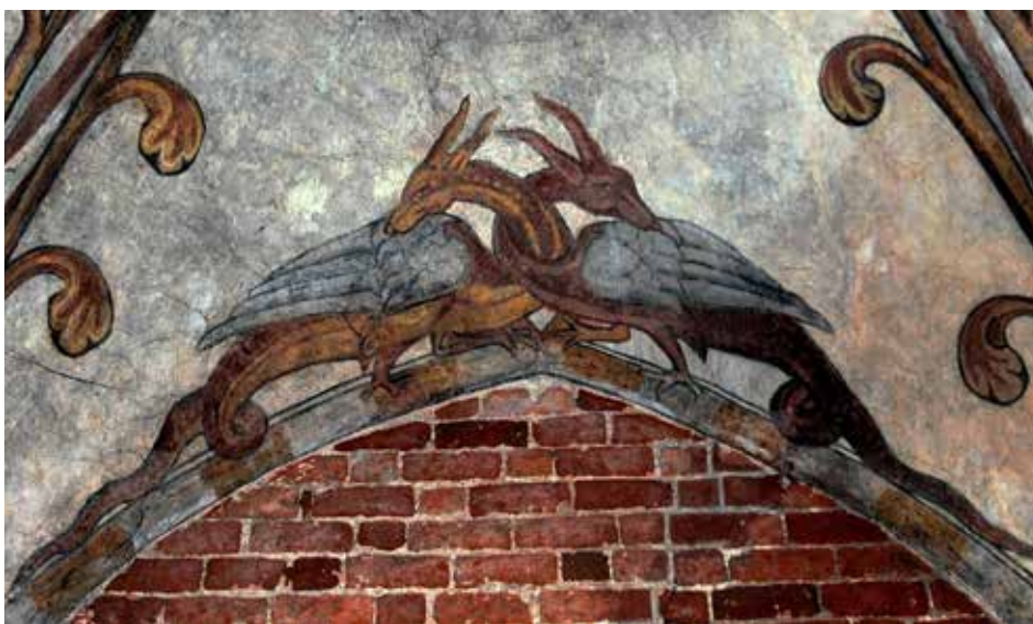
Kamień Pomorski. Katedra. Kaplica. Fragment malowideł na sklepieniu, lata 20.–30. XIII w.

Na dekorację kaplicy składają się: portal z rzeźbami prowadzący z prezbiterium do wnętrza, a w środku malowidła na sklepieniu, wsporniki z postaciami atlantów oraz z ceramicznymi maskami z głowami ludzi i zwierząt rodem z bestiariuszy, zestawione na zasadzie opozycji dobra i zła 57 . Jeden ze wsporników zdobi głowa kobiety o szlachetnym, choć surowym obliczu. Twarz jej okala podwika, a na głowie znajduje się diadem książęcy. Czyżby była to aluzja do rządzącej krajem księżnej Anastazji? To i inne, zaskakujące wymową przedstawienia, jak choćby w strefie portalowej – wymagają jeszcze szczegółowej analizy. Sygnalizowana w wielu publikacjach niezwykłość tego wnętrza oraz fakt, że było ono najwcześniej zadaszoną częścią katedry 58 , każe przypuszczać, że chodzi o kaplicę biskupią lub może książęcą. Być może kaplica ta powstała w ogóle jako samodzielny budynek, a jej bogate dekoracje wiążą się ze szczególną rangą politycznego ośrodka, jakim był Kamień w czasie pobytu tu Anastazji.