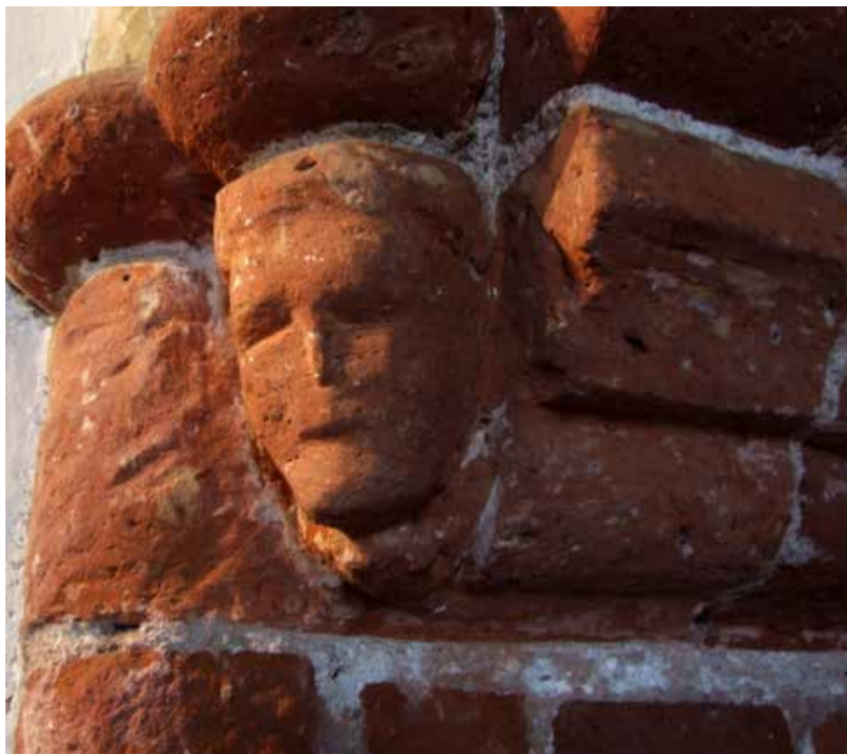
Kamień Pomorski. Katedra. Kaplica. Maska ceramiczna z twarzą władczyni ( rysy silnie zniszczone) na wsporniku sklepienia, lata 20.–30. XIII w.

Z Anastazją jako fundatorką należy związać też niektóre cenne przedmioty, które w późniejszych wiekach znalazły się w skarbcu katedralnym. Szczególnie prawdopodobne jest, że kadzielnica z około 1200 r., uznana za wyrób bizantyjski lub pochodzący z południowej Rusi 59 , została przywieziona właśnie stamtąd przez matkę Anastazji – księżnę Eudoksję. Na Pomorze kadzielnica mogła trafić, gdy wygnana wraz z mężem z Wielkopolski Eudoksja znalazła schronienie na dworze księcia Bogusława I. Kolejno – jako dar księżnej Anastazji – kadzielnica mogła znaleźć się w katedrze.