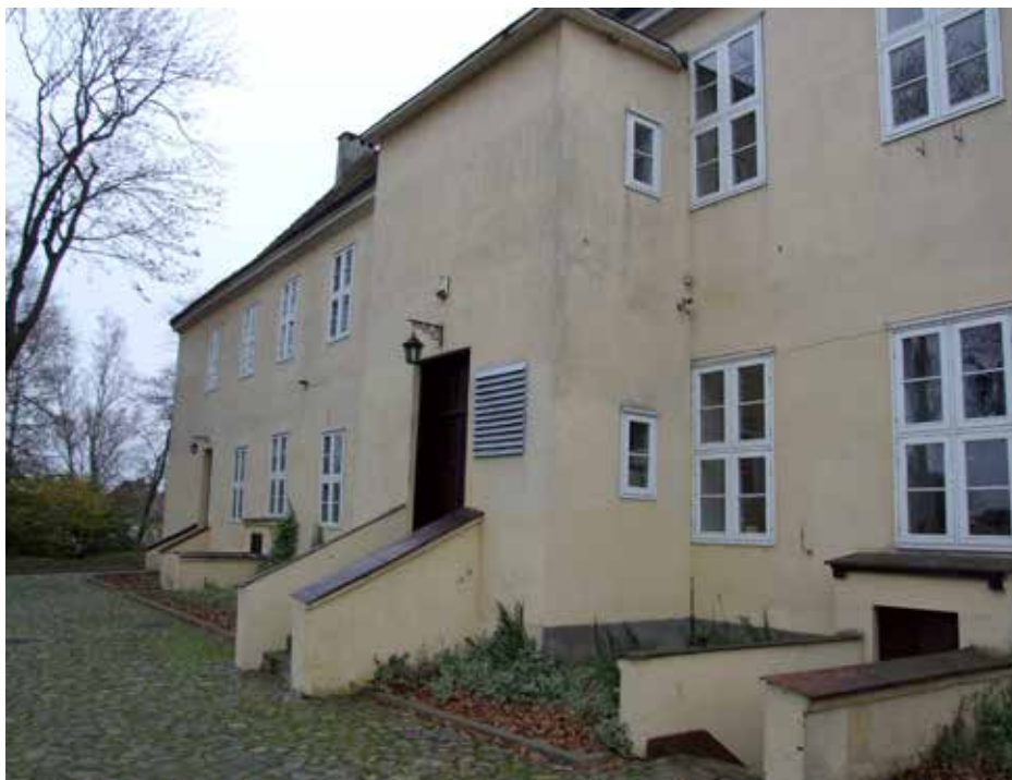
Trzebiatów. Północne skrzydło pałacu z lat 80. XVII w., którego piwnicę stanowią mury domu wzniesionego przypuszczalnie przez Anastazję w latach 30. XIII w.

i jego przeznaczenie mogą rozstrzygnąć jedynie dalsze badania archiwalne i archeologiczne, które należałoby przeprowadzić w części dotąd nie przebadanej – północnym obszarze dawnego grodu.