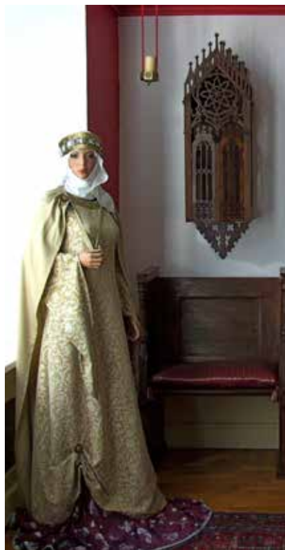
Postać księżnej Anastazji w zrekonstruowanym stroju z epoki. Muzeum Pałacowe TOK w Trzebiatowie.

Anastazja Piastówna – żona księcia pomorskiego Bogusława I – była córką Mieszka III Starego (trzeciego spośród żyjących synów w chwili śmierci Bolesława Krzywoustego 1 ), który na mocy testamentu swego ojca władał zachodnią częścią Wielkopolski – z Poznaniem jako głównym grodem. Matką Anastazji była druga żona Mieszka – księżniczka Eudoksja, córka księcia kijowskiego Izjasława II 2 . Mieszko poślubił ją około 1154 r., wkrótce po śmierci swej pierwszej żony – Elżbiety węgierskiej. Anastazja była najmłodszym dzieckiem pary książęcej. Dokładna data jej narodzin nie jest znana. W niektórych opracowaniach przyjmuje się, że przyszła na świat na krótko przed 1164 r. 3 , w innych ogólnie – przed 1170 r. 4