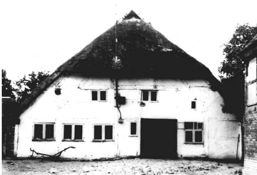
il. 3. Krupy k/Darłowa – chałupa Vanselowa z 1717 r. repr. PKZ Szczecin nr 8636/R

i kształcie dachu zbliżonym do pierwotnych wzorców, ale już o nowej organizacji wnętrza – m.in. z dużymi izbami od frontu, kuchniami oraz małymi sieniami. W tym drugim przypadku możemy zakładać, że wzór chałupy saskiej stanowił raczej inspirację dla ówczesnych architektów czy budowniczych, tym bardziej że budynki te pochodziły z 2 poł. XVIII lub pocz. XIX wieku, czyli z okresu po licznych uregulowaniach prawnych i budowlanych.