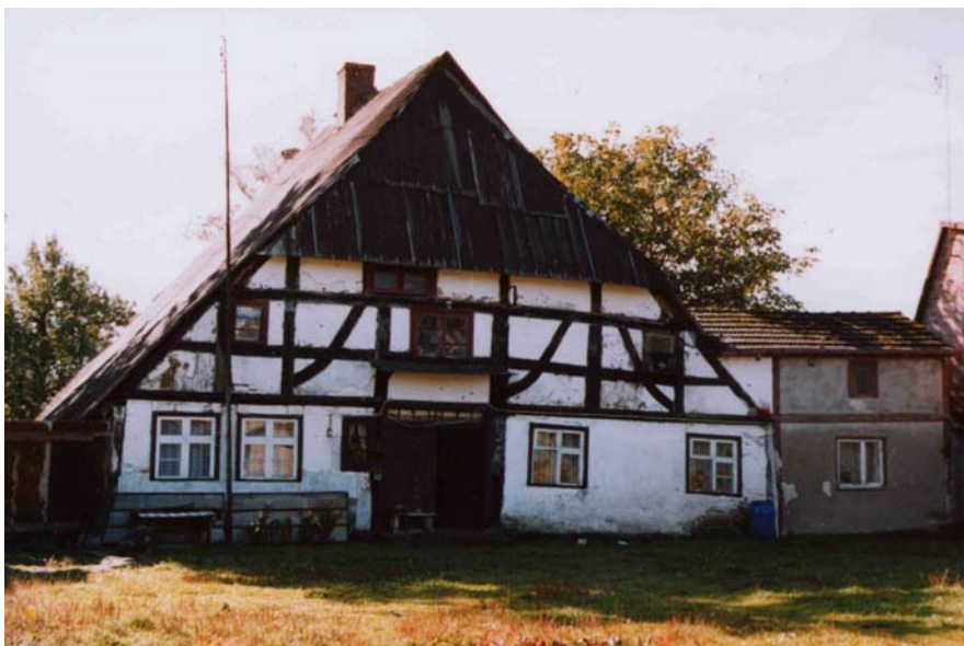
il. 5. Krupy 26, gm. Darłowo, foto. W. Witek, 2003 r.

Obiekt wzniesiony w 1 ćw. XVIII wieku - analogicznie jak sąsiednia i datowana (1717 r.) chałupa - w ramach czworobocznej (zamkniętej) zagrody bogatego chłopa o nazwisku Maass. Pierwotnie była to chałupa bezkominowa (o czym świadczy warstwa sadzy na konstrukcji więźby dachowej i stropach II kondygnacji), z przelotową i wysoką sienią (Diele), paleniskiem otwartym, nakryta dymnikowym dachem czterospadowym.