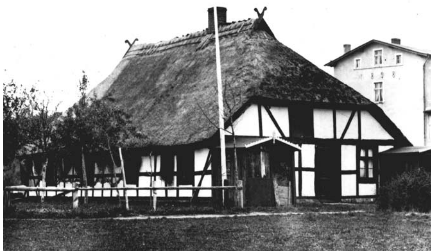
il. 4. Mrzeżyno – chałupa rybacka typu saskiego repr. H. Lemcke, Bau und Kunstdenkmäler ... , Kreis Greifenberg, Hf. 11, Stettin 1914

Inny typ chałup, wzniesionych na wzorce domu saskiego, związany był z budownictwem pasa nadmorskiego 19 . Chałupa saska odpowiadała rybakom, zarówno organizacją wnętrza, jak i formą wysokiego (czterospadowego) dachu, który chronił przed trudnymi – w tym regionie – warunkami atmosferycznymi (il. 4). Ten typ budownictwa przetrwał we wsiach rybackich do czasów II wojny światowej, tworząc całościowo zachowane enklawy (np. Dąbki, Kępa, Mrzeżyno, Niechorze), które stanowiły również przedmiot badań naukowych nad ewolucją pierwotnej formy architektonicznej w nowych warunkach środowiskowych, a także interesujący motyw w malarstwie 20 . Na tak długie zachowanie się tego typu budownictwa – i to w stosunkowo „czystej” formie – istotny wpływ miały określone warunki naturalne, które z jednej strony utrudniały dostęp do wsi, a z drugiej pozwalały na zachowanie pełnej naturalności i swobody w sposobie budowania. Owa dowolność doprowadziła także do pewnego zróżnicowania, tak w obrębie formy architektonicznej, jak rozplanowania wnętrza oraz funkcji poszczególnych pomieszczeń.