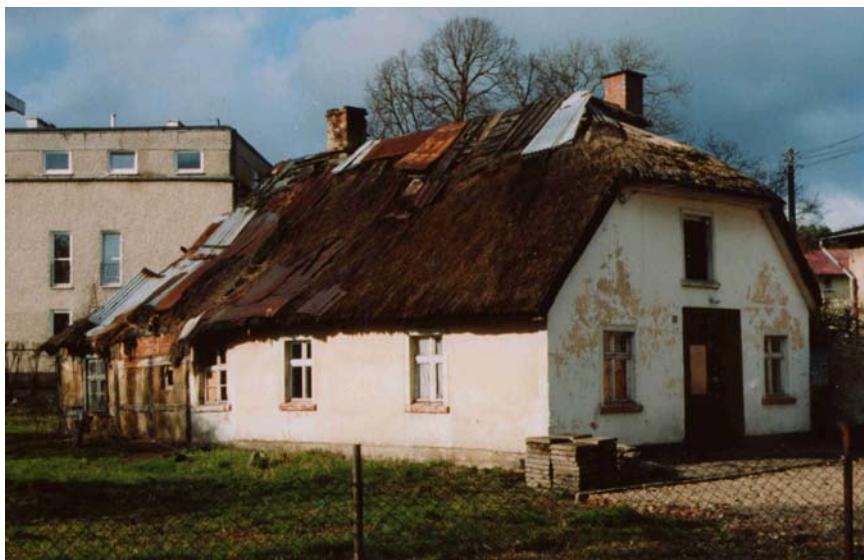
il. 6. Mrzeżyno, ul. Zabytkowa 4, 2004 r.